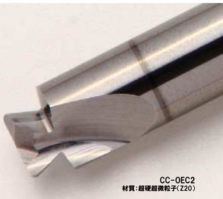
CC-OEC2 材質:超硬超微粒子(Z20)

Dovetail Cutter with R-Chamfering For O-Ring, 3-Flute HSS-Co (C-Coating)